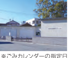
※ごみカレンダーの指定日以外で資源物を出せる場所です。(上記写真)

通常の回収とは別に資源物を拠点回収する場所です。 ●持ち込めるもの…缶・金属類、資源びん、新聞・折込チラシ、雑誌・雑がみ類、段ボール、飲料用紙パック、布・衣類、プラスチック製容器包装、ペットボトル、ガラス・くずびん類、陶磁器類、蛍光灯、乾電池、てんぷら油(厚生資源拠点ステーション除く) ●開場日…下図をご覧ください。(年末年始は除きます。) ●開場時間…9:00~16:30 【お願い】燃えるごみ、粗大ごみ、事業活動に伴う資源物を持ち込むことはできません。