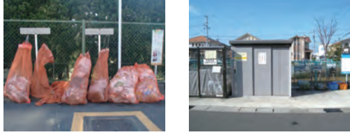
※ごみカレンダーの指定日に資源物を出す場所です。(上記写真)

●回収日 週1回…プラスチック製容器包装 月1回…缶・金属類、資源びん、新聞・折込チラシ、雑誌・雑がみ類、段ボール、飲料用紙パック、布・衣類、ペットボトル、ガラス・くずびん類、陶磁器類 ※回収日は、お住まいの地区により異なります。ごみカレンダーでご確認ください。 ※回収日当日、朝8時30分までに出してください。